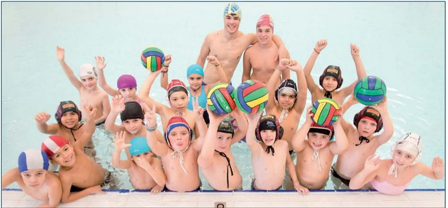
Los más txikis disfrutando del campus de waterpolo en las piscinas de Lakua.