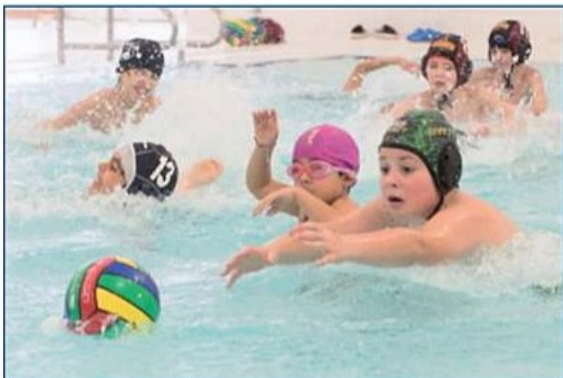
Venga... ¡a por el balón!