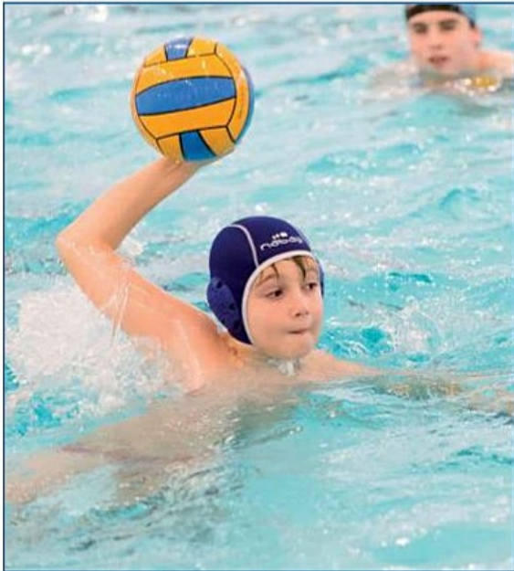
Practicando el tiro a puerta.