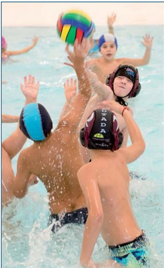
Intentando bloquear el lanzamiento.