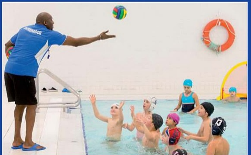
A ver quién lo pilla primero.

do alegrías. Porque si quienes conforman el club tuvieran que echar mano de una palabra para describirlo dirían éxito. "La convocatoria navideña del pasado año tuvimos 15 chaval@s, y éte ha igualado a la participación a los campus de abril y septiembre", explican. En total 39 niños y niñas de 6 a 13 años que se animaron a conocer el practicar el waterpolo del 2 al 4 de enero.