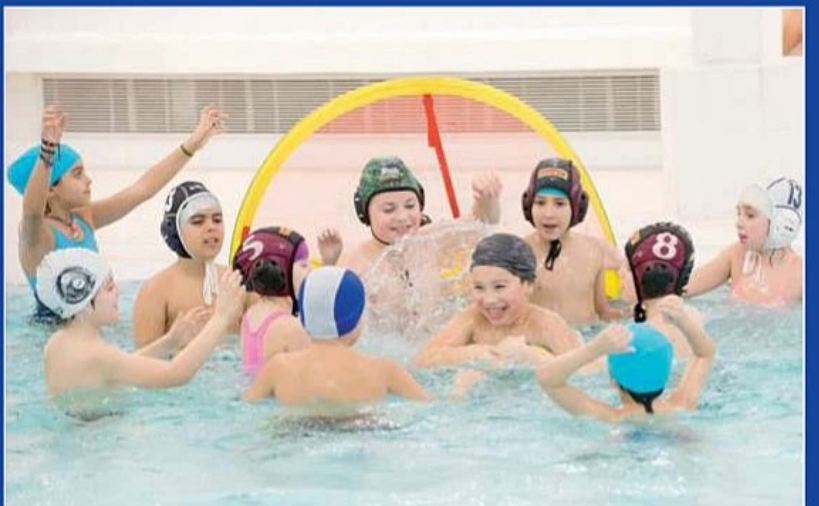
Un poco de jaleo en la portería, que nunca viene mal.